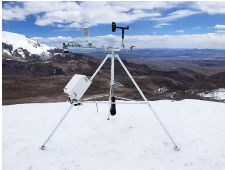
Figura 2. Instalación del EMA, en la UH Llaca en el marco del proyecto PASTURE