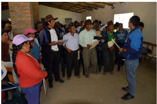
Foto 5: Negociación para la instalación de la 2da parcela de investigación