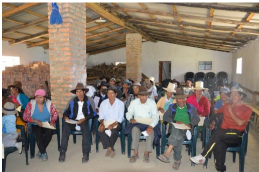
Foto 1: Parte del público asistente al taller (principalmente agricultores, y ganaderos)