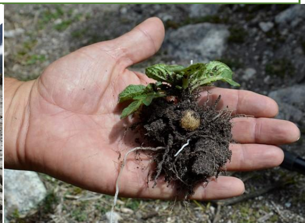
Foto 6: Ejemplar de papa silvestre encontrado en la quebrada de Santa Cruz.