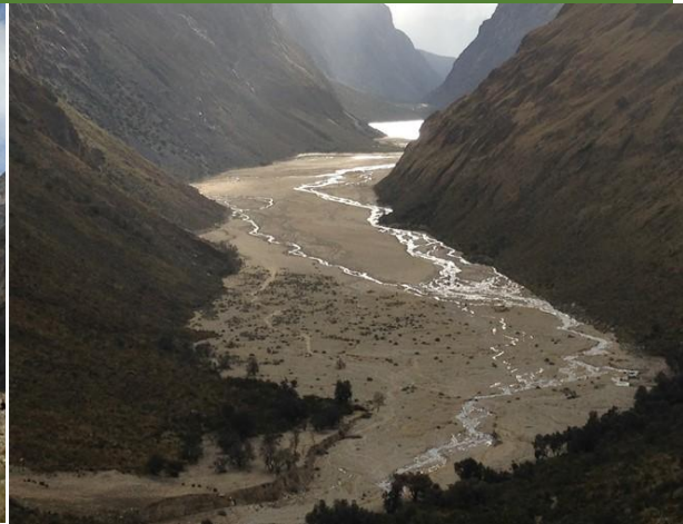
Foto 2: Paisaje visto desde Taullipampa con bofedales impactados del Aluvión 2012