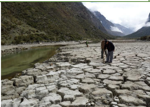
Foto 5: Laguna Ichicocha con presencia de lodo agrietado sin agua